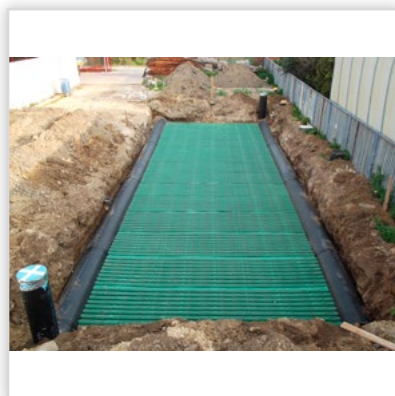
Gruntowy wymiennik ciepła GEOSTRONG – dla hali produkcyjnej. GWC bezprzepływowy modułowy. Przepływ powietrza turbulenty, wymiana cieplna ze wszystkich stron GWC. Wytrzymałość na nacisk z góry: 460 t/m 2 . Zastosowanie: w wentylacji mechanicznej we współpracy z rekuperatorem w obiektach użyteczności publicznej, pawilonach, magazynach, restauracjach. Możliwość wykonania GWC o każdej wielkości przepływu powietrza. Możliwość samodzielnego montażu.