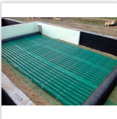
Gruntowy wymiennik ciepła GEOSTRONG – w fundamentach. GWC bezprzepływowy modułowy. Przepływ powietrza turbulenty, wymiana cieplna ze wszystkich stron GWC. Wytrzymałość na nacisk z góry: 460 t/m 2 . Zastosowanie: w wentylacji mechanicznej we współpracy z rekuperatorem w domach jednorodzinnych, wielorodzinnych i przemysle. Możliwość wykonania GWC o każdej wielkości przepływu powietrza. Możliwość samodzielnego montażu.