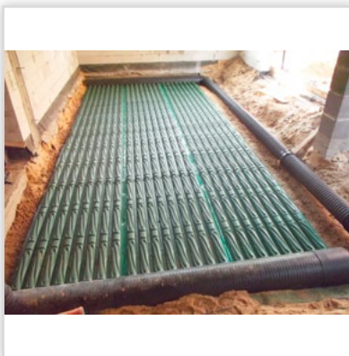
Gruntowy wymiennik ciepła GEOSTRONG – w fundamentach