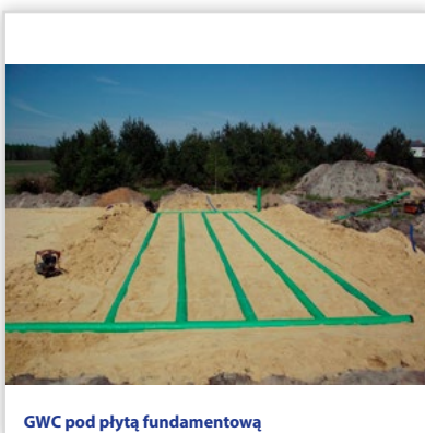
GWC pod płytą fundamentową