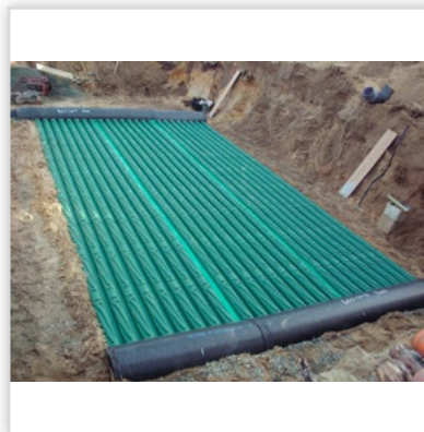
Gruntowy wymiennik ciepła GEOSTRONG – na zewnątrz domu