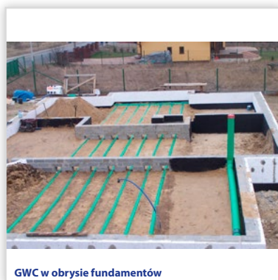
GWC w obrębie fundamentów