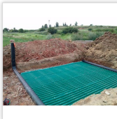
Gruntowy wymiennik ciepła GEOSTRONG – na zewnątrz domu. GWC bezprzepływowy modułowy. Przepływ powietrza turbulenty, wymiana cieplna ze wszystkich stron GWC. Wytrzymałość na nacisk z góry: 460 t/m 2 . Zastosowanie: w wentylacji mechanicznej we współpracy z rekuperatorem w domach jednorodzinnych, wielorodzinnych. Możliwość wykonania GWC o każdej wielkości przepływu powietrza. Możliwość samodzielnego montażu.